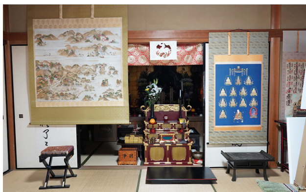
薬師堂に伝わる絵巻。おぶわれている人や杖をついて歩く人など江戸中期の城崎温泉の様子が描かれている